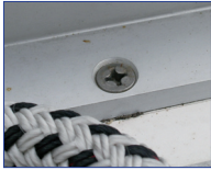
VA-Schraube in Alu- Fussreling