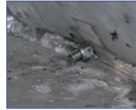
VA- Schrauben in Alu- Schweißnaht