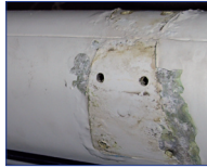
Korrodiertes Alu- Mast