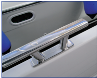
Edelstahlbeschlag auf Aluminiumrumpf