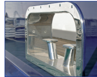
Edelstahlbeschlag in Alu- Aussenhaut

TIKAL TEF-GEL ist eine wasserfeste, auf PTFE basierende Paste die das Aufblühen von Metall verhindert und zuverlässig Korrosion durch galvanische Ströme zwischen unterschiedlichen Metallen verhindert. Überall dort, wo edle Metalle mit unedleren Metallen (z.B. Aluminium mit Edelstahl) in direkten Kontakt kommen, genügt bereits eine geringe Menge TIKAL TEF-GEL um den galvanischen Austausch von Elektronen und die daraus folgende Korrosion zu verhindern.