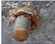
Korrodierte VA-Schraube in Alu