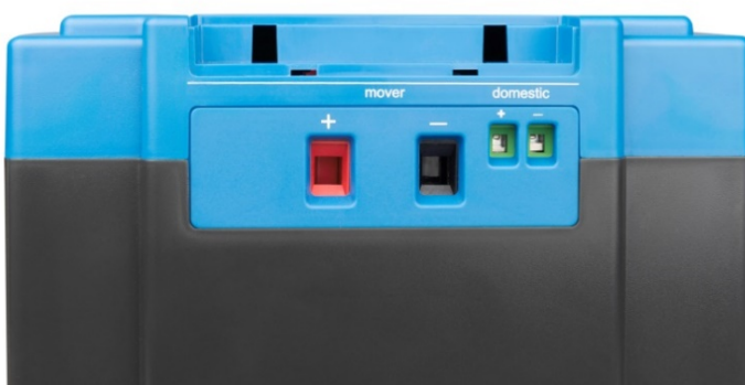
Hochleistungsausgang (Mover) und Niedrigleistungsausgang (Domestic)