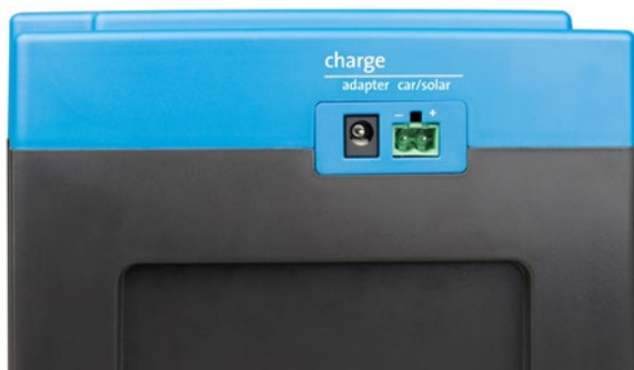
Adapter und Eingänge Fahrzeug/Solarmodul (Car/Solar) (Buchse für den Car/Solar-Eingang wird mitgeliefert)