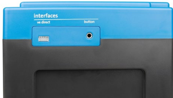
VE.Direct und Druckknopf