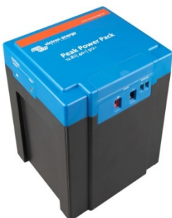
12,8 V, 40 Ah