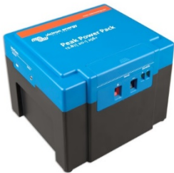
12,8 V, 20 Ah