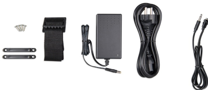
Befestigungsriemen Adapter Stromkabel Druckknopf mit Kabel (2 m) und zweifarbiger LED