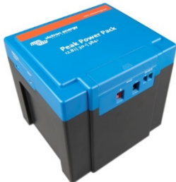
12,8 V, 30 Ah