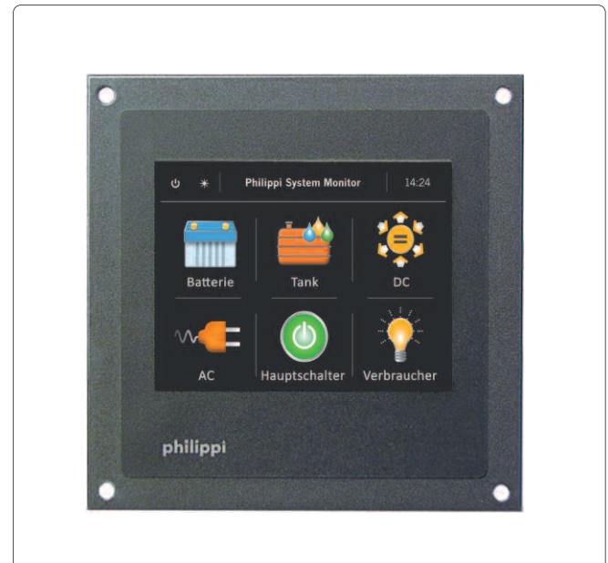
PSM 2 Bestell-Nr.: 0 7100 2235

Im Hauptmenü sind die Menüpunkte aktiv, zu denen von den angeschlossenen Geräten Daten zur Verfügung stehen. Dies wird durch die farbige Symboldarstellung angezeigt.