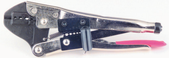
■ UNI-Crimp WZ 45 Bestell-Nr.: 5 0000 0045

Schrumpfschlauch mit Schmelzkleber zur professionellen Abdichtung und Polaritäts-Kennzeichnung. Schrumpfrate 3:1, Durchmesser 19 mm. Lieferung rot und schwarz, Länge je 0,3 m.