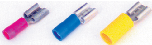
Flachsteckhülsen mit Isolation. Verpackungseinheit 10 Stück