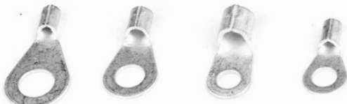
Quetschkabelschuhe, Ringform. Verpackungseinheit 10 Stück