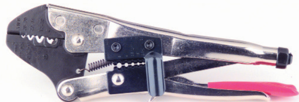
■ UNI-Crimp WZ 43 Bestell-Nr.: 5 0000 0043

Crimpzange für lötfreie Flachsteck-Verbinder mit Isolation . Integrierter Drahtschneider, Abisolier Vorrichtung für Leiter 0,5–6 mm 2 . Drei verschiedene Profilgrößen, Querschnittsbereich 0,5–6 mm 2 .