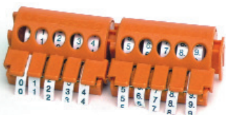
■ KMS 10 Bestell-Nr.: 5 0024 0009

Handliches Kennzeichnungssystem für die individuelle Kabelmarkierung. Integrierte Schneidvorrichtung. Polyester-Klebeband, Breite je Rolle 5 mm, Länge 2,7 m. Beschriftungen 0-9.