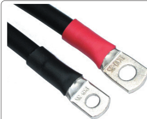
■ SSK 19 Bestell-Nr.: 6 0012 1190

Schrumpfschlauchset schwarz bestehend aus 5 Stücken (3,2 / 4,8 / 6,4 / 9,5 / 12,7 mm) je 50cm Länge. Schrumpfrate 2:1.