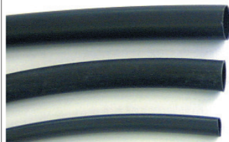
■ SSB-Set Bestell-Nr.: 6 0012 9005

Handliches Kennzeichnungssystem für die individuelle Kabelmarkierung. Integrierte Schneidvorrichtung. Polyester-Klebeband, Breite je Rolle 5 mm, Länge 2,7 m. Beschriftungen 0-9.